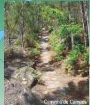
Caminho de Campos