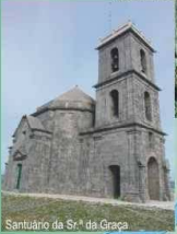
Santuário da Sr.ª da Graça