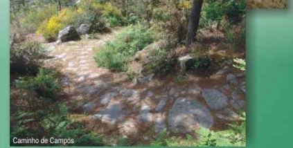
Caminho de Campos