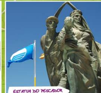
ESTATUA DO PESCADOR