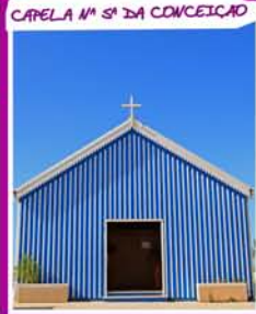
CAPELA N.ª SR.ª DA CONCEIÇÃO

bastante vocacionada para o Turismo e galardoada com a Bandeira Azul desde 1987.