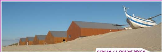
CIPCAM / LOTA DE PESCA

Quase a terminar a visita, junto ao Museu, o Parque de Lazer da Barrinha , janela de excelência desta grande lagoa, convida à contemplação e ao descanso. Visite também o Museu do Barco , dedicado às embarcações tradicionais desta zona costeira e os Viveiros Piscícolas . Finalizamos com a chegada ao Clube Náutico , onde se praticam diversos desportos aquáticos/náuticos.