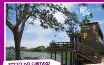
SÍTIO DO CARTAXO

Retomemos a rota e à tranquilidade desta zona lagunar, ladeada por campos agrícolas e pelo verde da vegetação que cobre a sua margem, somamos a calma da Floresta – Dunas e Pinhais de Mira, para onde seguimos, sempre pela Pista Ciclo-Pedonal, até à Praia de Mira. Do nosso lado direito (a norte), segue a Vala do Regente Rei e a Sul, um pouco mais distante, a Vala Real. Caminhamos ladeados por Pinheiros-bravos, Pinheiros-mansos, Eucaliptos, Acácias e por diversos arbustos aromáticos e coloridos, rumando à Praia de Mira. A moldura do casario, outrora, lugar de palheiros típicos, abeira-se de cursos de água, do areal, do Oceano Atlântico e da Barrinha - todos estes espaços naturais