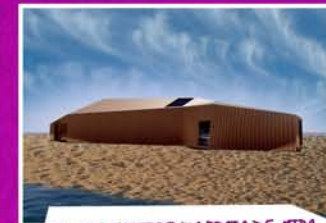
CLUBE NÁUTICO DA PRAIA DE MIRA

Tratando-se de um percurso bidireccional podemos inicia-lo quer no Núcleo Museológico – Museu do Território da Gândara, em Mira, quer no Clube Náutico, na Praia de Mira. Nesta descrição consideramos o Museu do Território como o nosso ponto de partida. Prosseguimos por estradas e caminhos rurais, observando campos agrícolas, terrenos florestais e o casario até à Lagoa de Mira. A diversidade biológica aí existente convida-nos a uma paragem para observar plantas ribeirinhas e animais. Já que estamos na Pista Ciclo-pedonal, aproveitemos para visitar o Sítio do Cartaxo – Ecoturismo, na margem nascente desta lagoa, e aí acedemos a mais informação sobre a biodiversidade/ambiente e cultura da região.