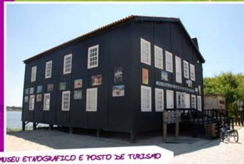
MUSEU ETNOGRÁFICO E POSTO DE TURISMO