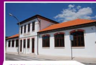
MUSEU DO TERRITÓRIO DA GÂNDARA

A Rota dos Museus é um Percurso de Pequena Rota integrado na Rede Municipal de Percursos Pedestres de Mira. Este percurso interpretativo possibilita-nos o contacto com aspectos característicos do diversificado património cultural e ambiental deste concelho, visitando um conjunto de museus também dedicados a essas heranças patrimoniais.