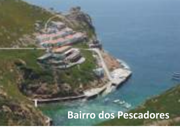
Bairro dos Pescadores