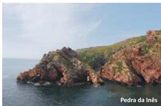
Pedra da Inês