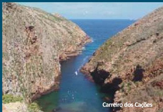
Carreiro dos Cações