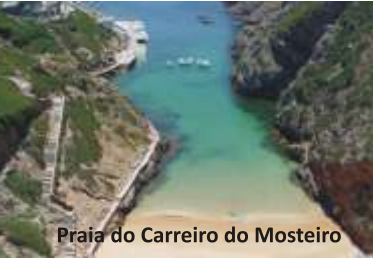
Praia do Carreiro do Mosteiro