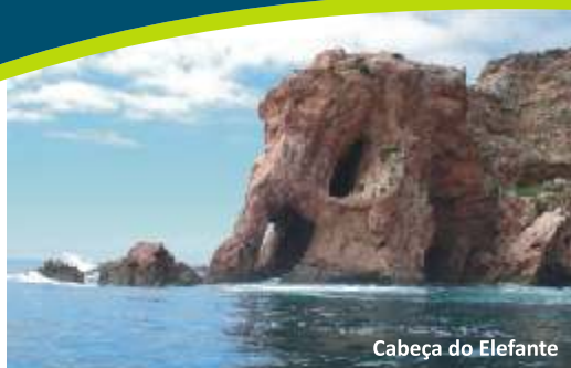
Cabeça do Elefante

As características únicas, nomeadamente a geografia e o clima, conduziram à especiação de três endemismos florísticos. Assim, entre um elenco florístico de 135 taxa presentes no arquipélago, destacam-se, pelo enorme valor conservacionista Armeria berlangensis , Herniaria lusitanica subsp. berlangiana e Pulicaria microcephala , sendo que os dois primeiros constam do Anexo II da Directiva Habitats.