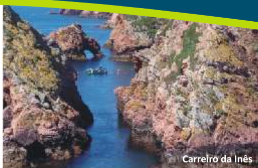
Carreiro da Inês