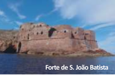
Forte de S. João Batista