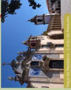
Igreja da República - S. João da Pesqueira