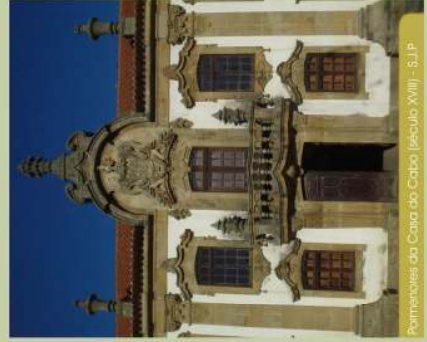
Portinheiros da Casa do Cabo (século XVIII) - S.J.P