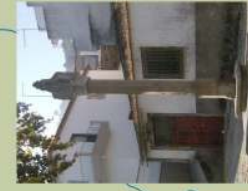
Foz da Oliveira