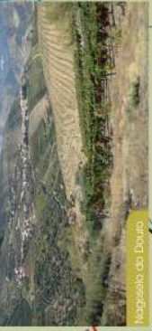
Nagoselo do Douro