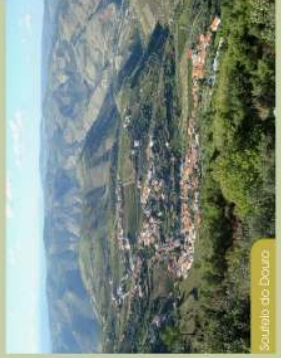
Soutelo do Douro