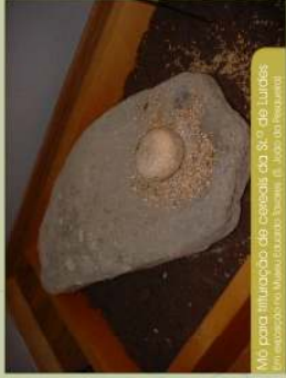
Mio para inibição de cascos do S.º de Lourdes (em exposição no Museu Municipal de S. João da Pesqueira)