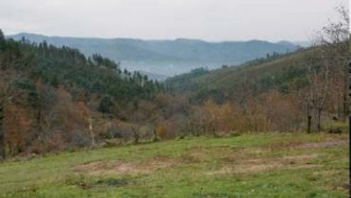
• Vista panorâmica