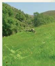
• Campo florido