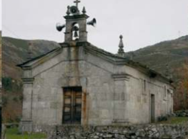
• Capela de Moimenta