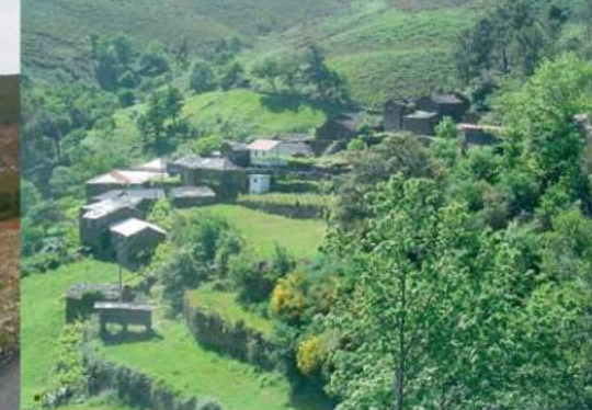
• Aldeia das Levadas

“Rio Tenente... as fortes trincheiras, o leito rochoso, a flora, os raios de sol e a água cristalina são o testemunho de que aqui tudo é natural!”