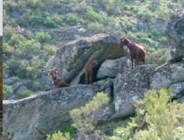
• Cabras de Montemuro