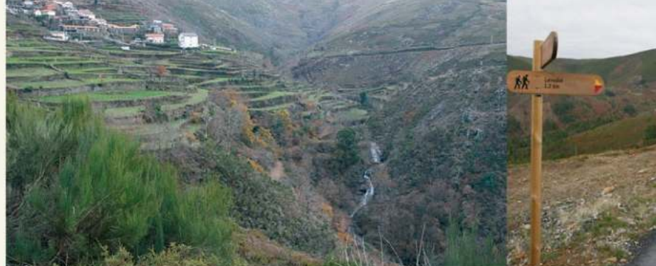
• Aldeia de Sabreda