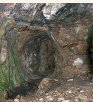
• Minas de volfrâmio

O percurso pode ser feito em ambos os sentidos.