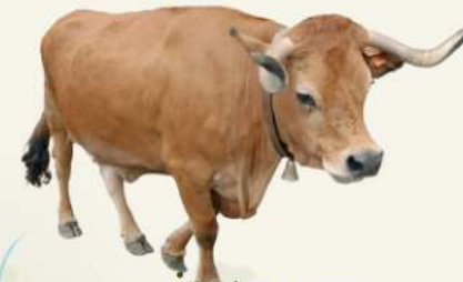
• Vaça de raça arouquesa

O Percurso das Minas é um percurso circular de pequena rota com elevado interesse paisagístico, cultural e ambiental. Apresenta uma extensão de 10,2 Km percorrendo terrenos situados entre altitudes de 550 a 800 metros.