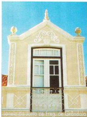
Igreja da Junta de Freg. de Grândola