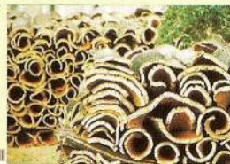
Pihas de cortiça