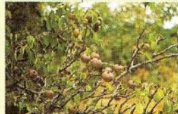
Pereira brava (Pyrus bourgaena)