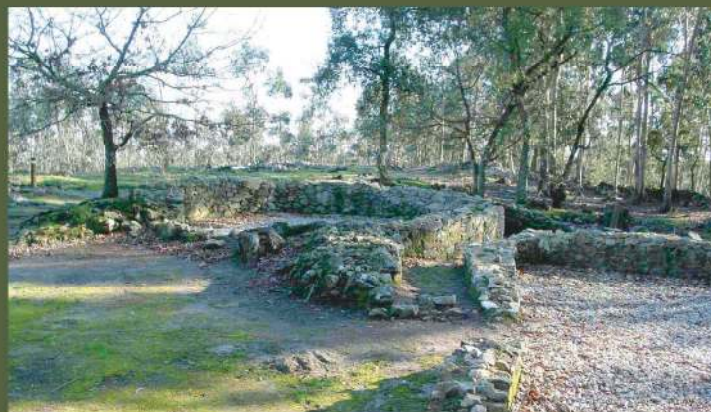
Cividade de Bagunte - Ruínas de um complexo habitacional