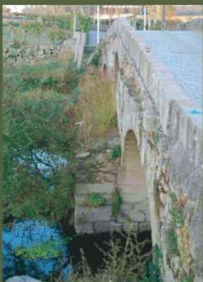
Ponte de Arcos

A PR 01 está devidamente assinalada segundo as regras internacionais que regulam a atividade pedestrianista. Em locais de maior relevância patrimonial existem painéis informativos que localizam o visitante.