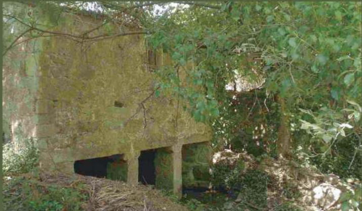
Moinho da Ribeira de Friães - Figueiró de Baixo