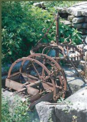
Nora para regadio