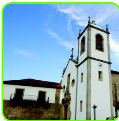
Síglas: MP 1758 - Memórias Paroquiais de 1758 MN - Monumento Nacional IIP - Imóvel de Interesse Público VC - Valor Concelhio