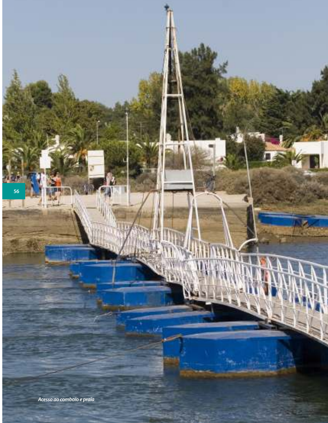
Acesso ao comboio e praia