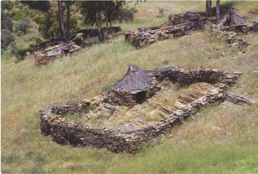
Curral de Gado Corral

A Nascente da Freguesia do Ameixial, este percurso segue até à fronteira com o Alentejo, definida pela Ribeira do Vascão, estendendo-se ao longo de um dos seus principais afluentes, o Vascãozinho.