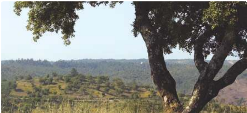
Vista Panorâmica Panoramic View