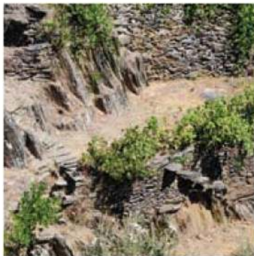
Vale de Muro