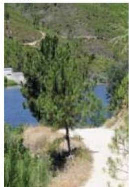
Percurso ao longo do rio

Maranho / Chanfana Peixes do Rio Arroz doce Tigelada Bolo de Azeite Filhoses