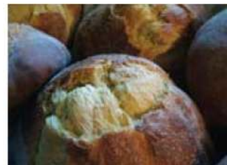
Bolo de Azeite