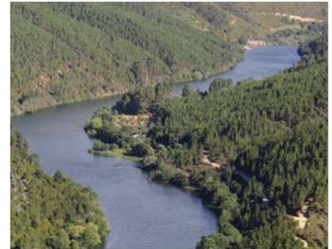
Meandros do Rio Zêzere

Porto de Vacas, aldeia da freguesia de Janeiro de Baixo, concelho de Pampilhosa da Serra é uma aldeia pitoresca situada à beira do Rio Zêzere. Toda a sua vida anda à volta deste elemento natural. São disso representativos o antigo açude que culmina nas velhas ruínas das azenhas, a nova mini-hídrica com o seu açude e a ponte que a Revolução de Abril veio trazer como principal infra-estrutura de ligação entre as margens do Zêzere. Mas é sem dúvida a memória da barca pública, que aqui transportava pessoas e animais, aquilo que dá maior identidade à comunidade. Para além do curioso e inesquecível topónimo que dá nome à aldeia – “Porto de Vacas”. Realce-se o enorme mural evocativo no largo das festas, ponto de partida para o nosso percurso. A aldeia hospitaleira como poucas, tem fortes tradições comunitárias ainda hoje muito vividas pelo povo, sobretudo na Festa em Honra de N.ª Sra. dos Aflitos, no 2º fim-de-semana de Agosto, e no tradicional Ano Novo onde ainda se cantam as Janeiras e se pode desfrutar uma maravilhosa couvada comunitária aberta a todos os forasteiros. De destacar como elementos patrimoniais dessa ruralidade partilhada o antigo forno de xisto de boa cozedura, a capela de S. Miguel, a Casa de Convívio e a antiga escola primária - futuro espaço interpretativo ligado às Barcas tradicionais do Zêzere.