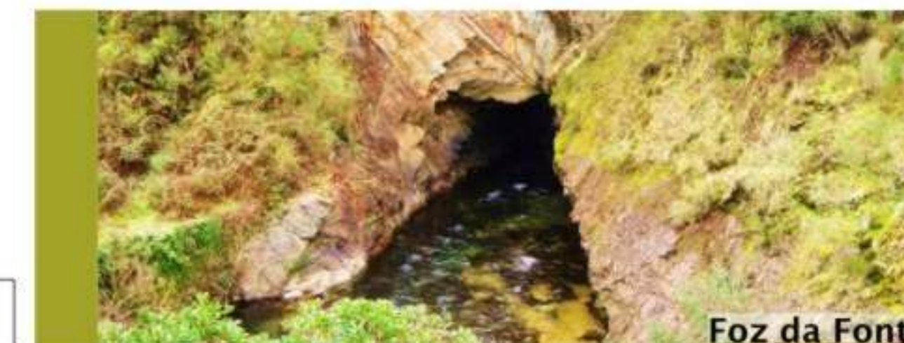
Foz da Fonte