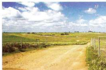
Caminho e vista de Entradas