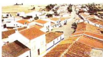
Casario de Entradas

Nesta localidade brilham as fachadas brancas debruadas pelas barras tradicionais ao longo da Avenida de Nossa Senhora da Esperança, com a sua característica calçada de empedrado. São de realçar a Igreja Matriz (Séc. XVIII), com o seu magnífico altar todo em mármore preto e branco de Estremoz, a Igreja da Misericórdia (Séc. XVI) e a Capela de Nossa Senhora da Esperança (Séc. XVI).