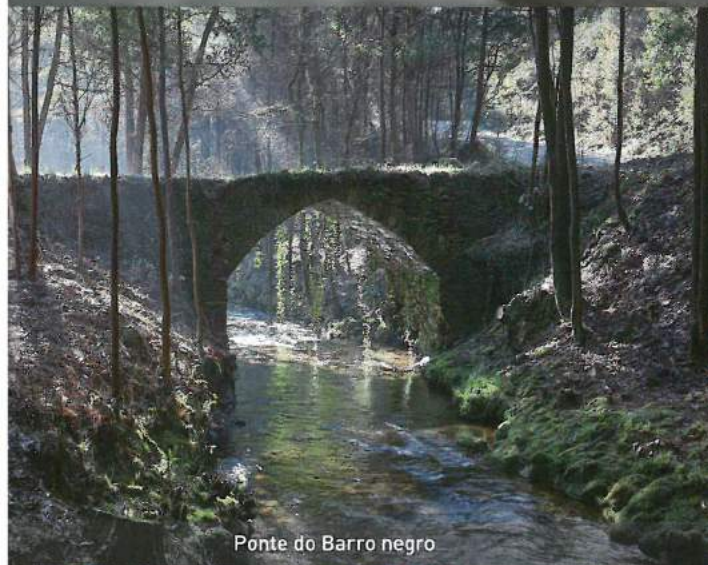
Ponte do Barro negro