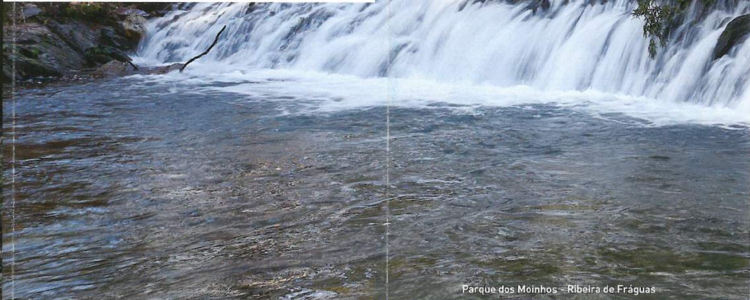
Parque dos Moinhos - Ribeira de Fráguas

Tecelagem, artes decorativas e bordados, trabalhos em madeira, esteiras em palha de bunho, olaria e cestaria.