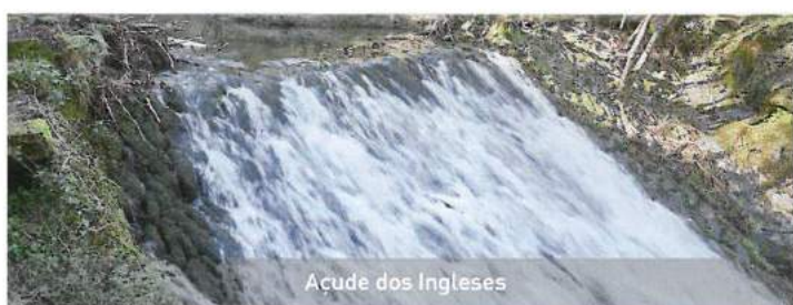
Açude dos Ingleses