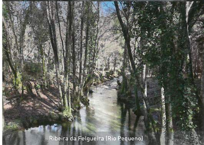
Ribeira da Felgueira (Rio Pequeno)