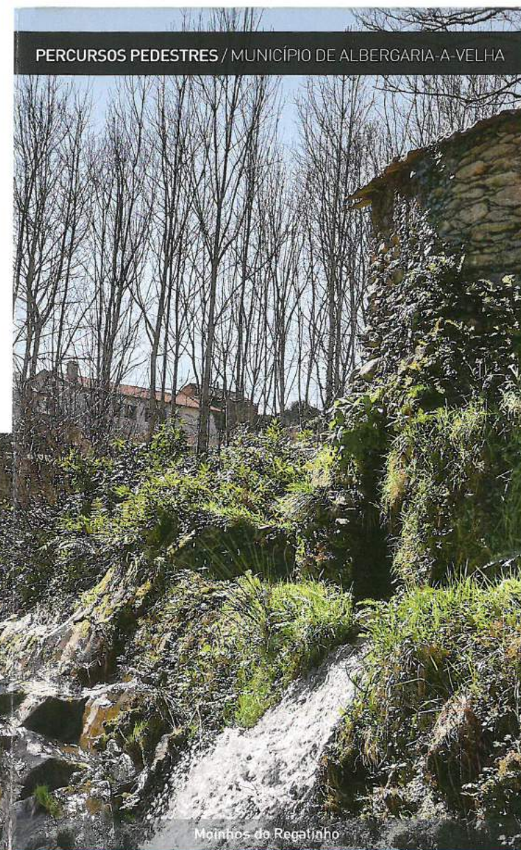
Moinhos do Regatinho