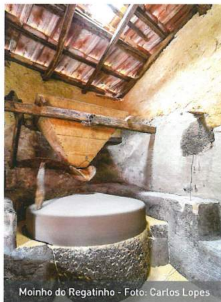
Moinho do Regatinho

Com início e fim no Centro de Atividades Radicais e Ambientais de Vilarinho de São Roque, outrora escola primária deste lugar, o percurso em formato de raquete, desce em direção ao vale, passando na Capela de São Roque. Seguindo pela estreita rua do Lugar de Baixo, tem-se como destino o rio Fílveda e os moinhos do Regatinho. Prosseguindo para montante, o caminho segue pela antiga levada do açude da lavoura, noutros tempos utilizada para fazer chegar a água aos campos de cultivo.