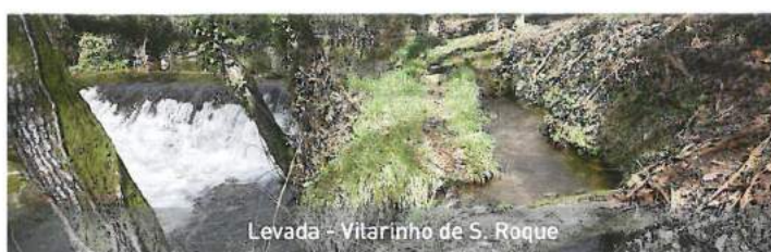
Levada - Vitarinho de S. Roque