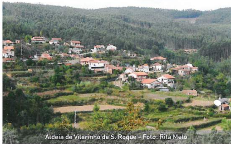
Aldeia de Vilarinho de S. Roque