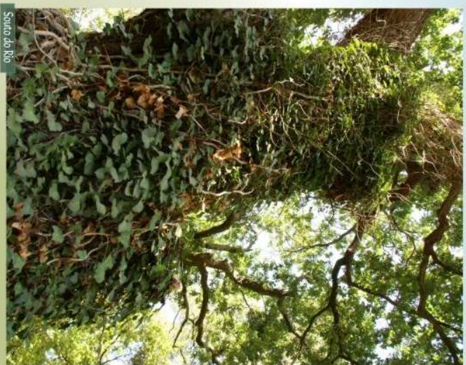
Souto do Rio