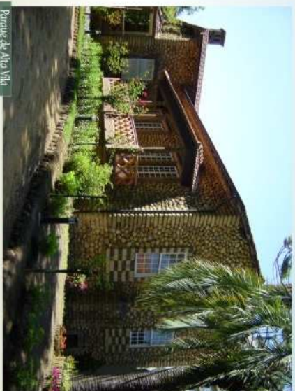
Parque de Alta Vila