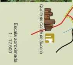
Escala aproximada 1 : 12500