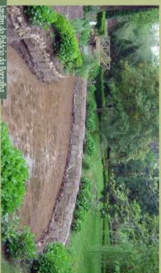
Jardim do Palácio da Borralha