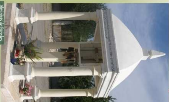
Alminhas de Paredes