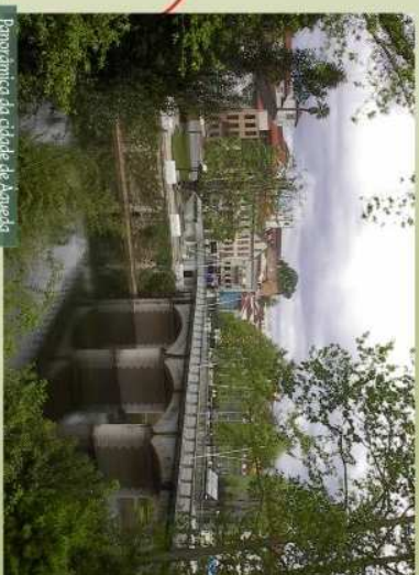
Panorâmica da cidade de Águeda