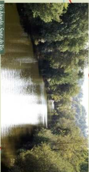
Rio Águeda - Souto do Rio